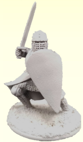
Gratisfigur zum Bemalen!

Jeder kennt klassische Brettspiele wie zum Beispiel Schach, bei denen die Figuren auf einem Spielbrett bewegt werden. Bei einem Tabletop-Spiel ist es genauso, außer dass je nach Spielsystem mal mehr oder weniger Figuren zum Einsatz kommen. Auch können die Figuren individuell bemalt werden. Ein Tabletop-Spiel benötigt nämlich kein Spielbrett beziehungsweise keine Spielfelder, da die Bewegung der Figuren je nach Spielsystem mit Maßbändern durchgeführt werden. Der Spieltisch wird mit passendem Gelände bestückt und schafft eine Atmosphäre. Beim Einsteiger-Spieletag sind Interessierte herzlich eingeladen mitzuspielen. An dem Tag wird mit dem Regelwerk SAGA (Hochmittelalter und Fantasy) gespielt. Einfach reinschauen und mitspielen.