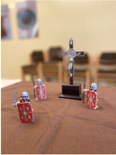
Kindergottesdienst am Karfreitag