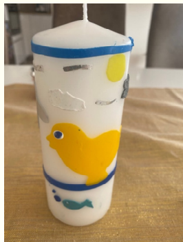
Kerzenbasteln am Karfreitag