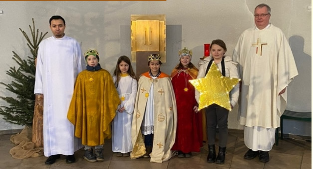
Sternsinger-Aktion im Januar